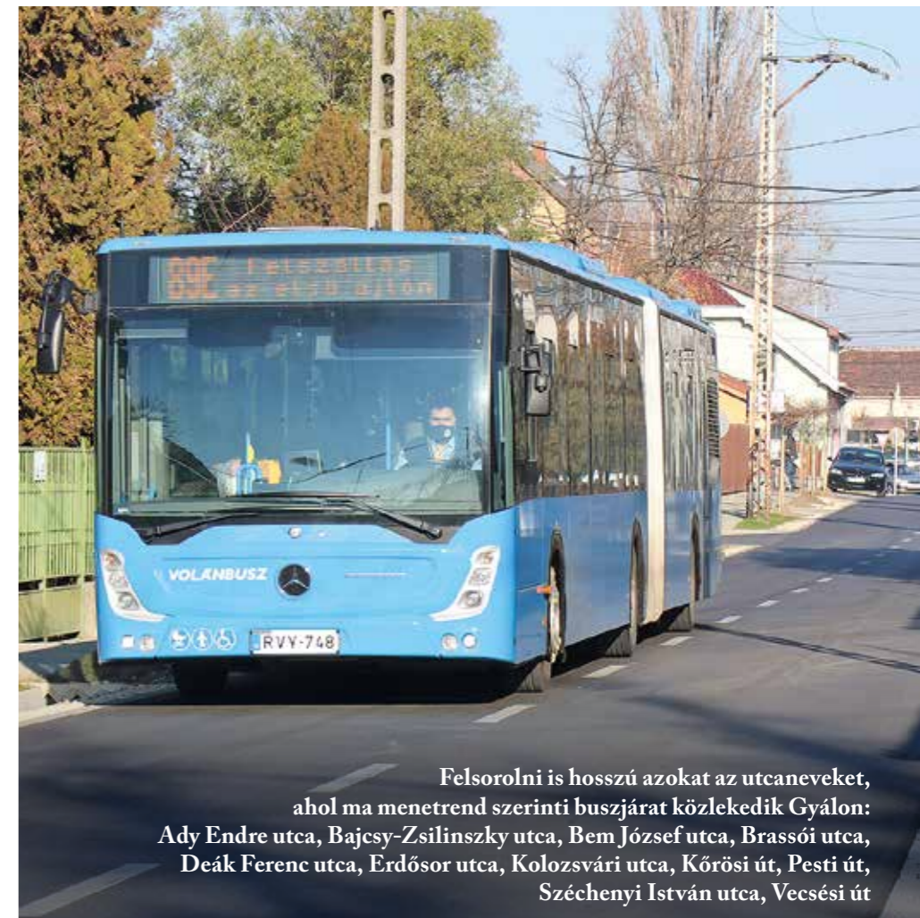
Felsorolni is hosszú azokat az utcaneveket, ahol ma menetrend szerinti buszjárat közlekedik Gyálon: Ady Endre utca, Bajcsy-Zsilinszky utca, Bem József utca, Brassói utca, Deák Ferenc utca, Erdősor utca, Kolozsvári utca, Körösi út, Pesti út, Széchenyi István utca, Vecsési út

A hálózat „extra pontja”, hogy a busz és a vasút nem ellenségek, hanem szöveteségek. Ha van épkezláb kapcsolat egy állomáshoz, az hirtelen kinyitja a térképet: nem csak a metró felé lehet gon-