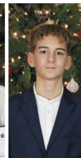
Bauer Balázs Gyáli Bartók Béla Általános Iskola - 8.a