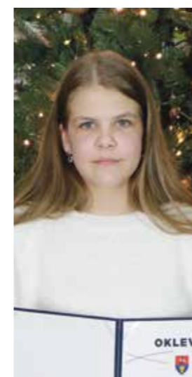
Bánóczy Réka Gyáli Zrínyi Miklós Általános Iskola - 8.a