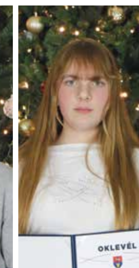
Poroszkai Noémi Gyáli Zrínyi Miklós Általános Iskola - 8.b