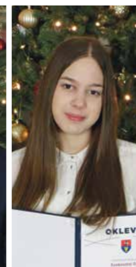
Szoboszlai Dóra Gyáli Ady Endre Általános Iskola - 8.b