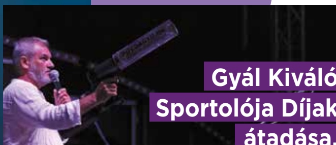
Gyál Kiváló Sportolója Díjak átadása, pólóágyúzás