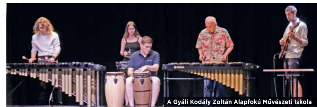
A Gyáli Kodály Zoltán Alapfokú Művészeti Iskola