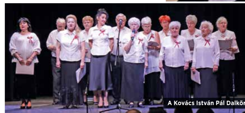
A Kovács István Pál Dalkör