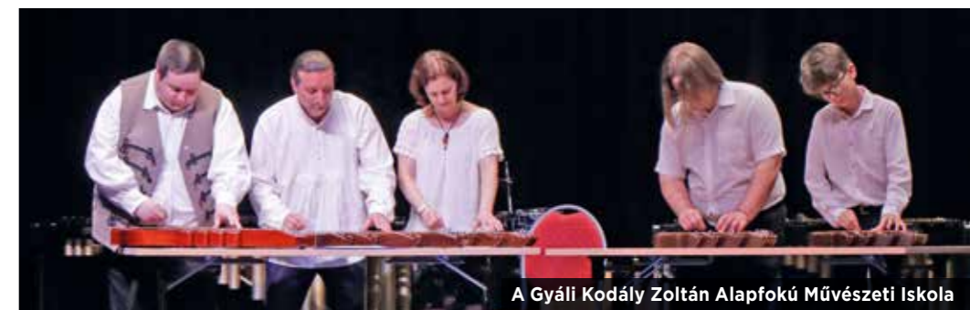
A Gyáli Kodály Zoltán Alapfokú Művészeti Iskola