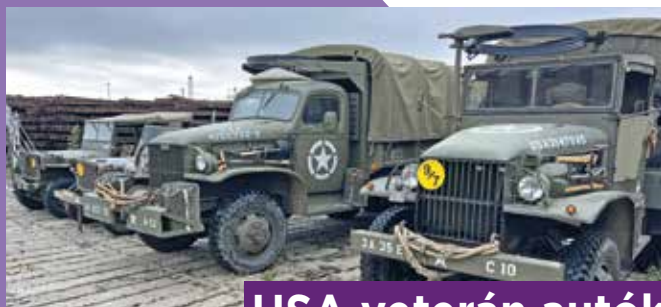
USA veterán autók