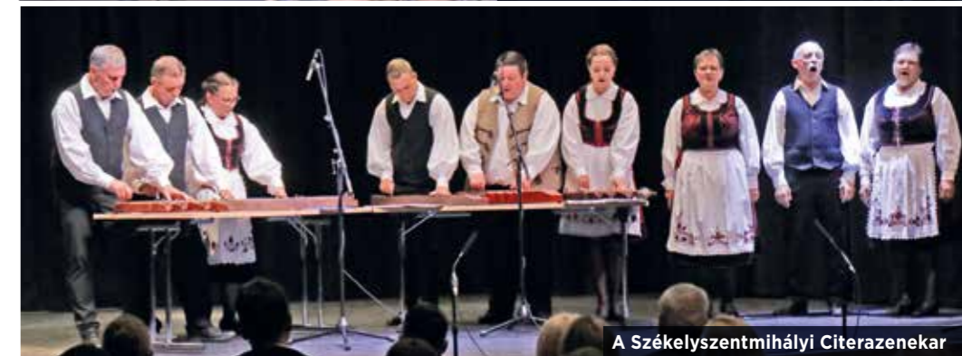
A Székelyszentmihályi Citerazenekar