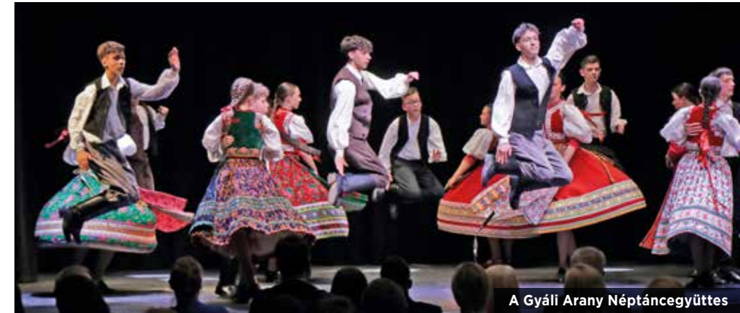
A Gyáli Arany Néptáncgyűttes