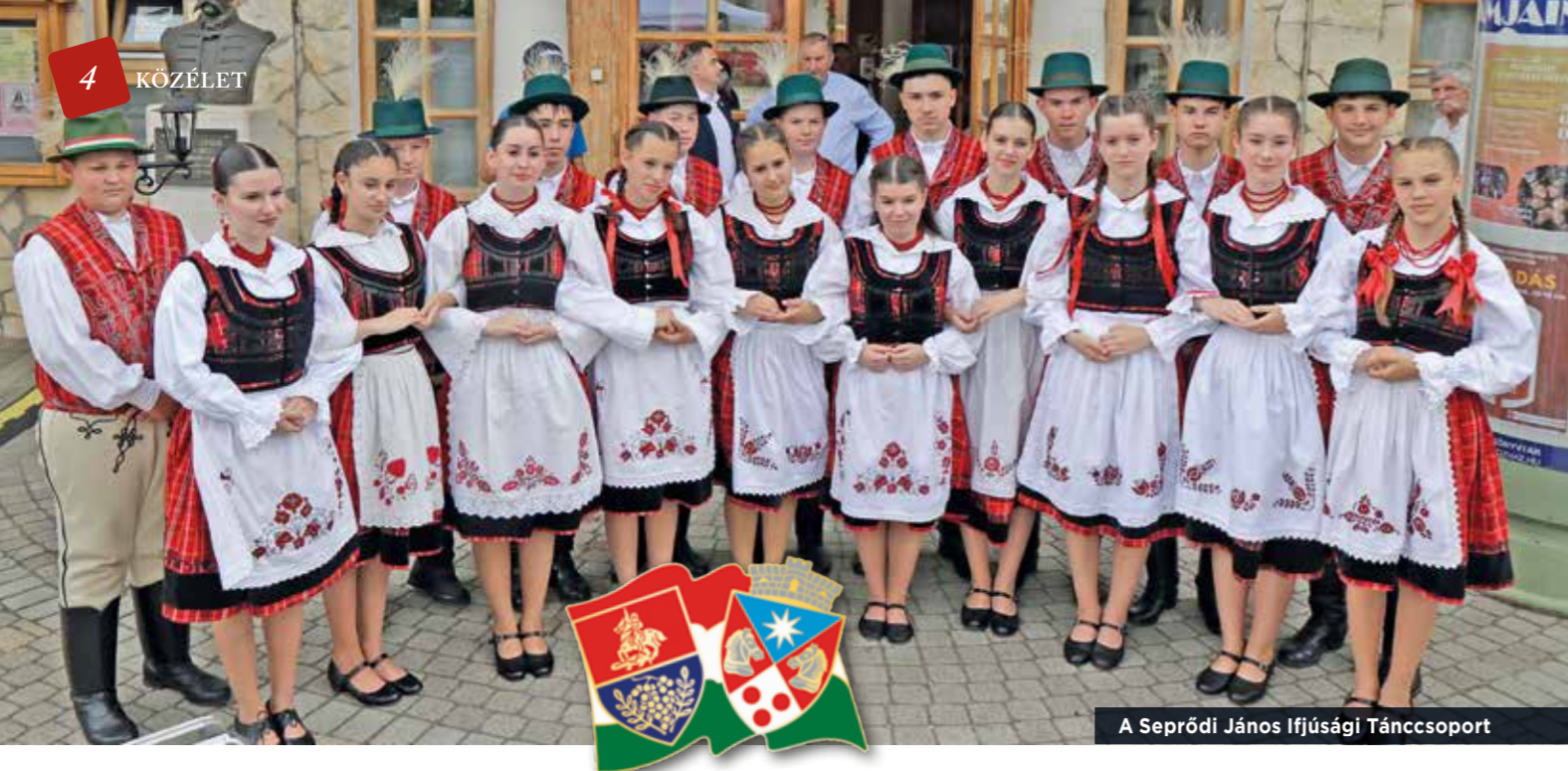
A Seprődi János Ifjúsági Táncsoport