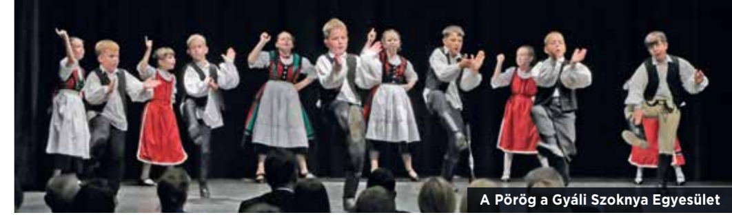
A Pörög a Gyáli Szoknya Egyesület

A beszédek végén átadtak egy mindkét település vezetője által aláírt emléklapot is, mely tanúsítja: tíz éve, hogy Gyál város és Kibéd a kölcsönös tiszteletre, nyitottságra és szeretetre alapozva élő testvértelepülési kapcsolatot ápolnak. Ez a kapcsolat „élő híd a szívek között”.