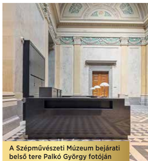
A Szépművészeti Múzeum bejárati belső tere Palkó György fotóján

A vállalat nevéhez olyan ikonikus építkezések kötődnek, amelyek az ország fejlődését szimbolizálják. Kiemelhető például Szépművészeti Múzeum bejárati belső tere, a Hard Rock Hotel belső terei, amely a Multistone Kft. szakértelmét és minőségi alapanyagait dicséri. Külföldi megrendelések is voltak, Hannoverben, Ausztráliában, Svájcban és Franciaországban. A Multistone Kft. elkötelezett a fenntartható működés mellett. Ennek érdekében környezetbarát technológiákat alkalmaz, minimalizálja a hulladékot, és különös figyelmet fordít az energiahatékonyságra. A cég jövőképe egyértelmű: a hagyományok megőr-