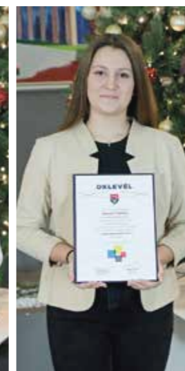
Durucz Titanilla Gyáli Ady Endre Általános Iskola - 8.c