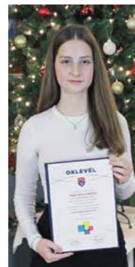
Nagy Nóra Stefánia Gyáli Ady Endre Általános Iskola - 8.b

A hagyományokhoz híven, a Gyáli Közművelődésért Díj felnőtt kitüntetettje 2025 januárjában, a Magyar Kultúra Napján veheti majd át a méltó elismerést. Ez az alkalom különleges helyet foglal el a város kulturális életében, hiszen ilyenkor nemcsak a díjazottak munkáját ismerik el, hanem egyben a magyar kultúra értékeinek fontosságát is ünneplik.