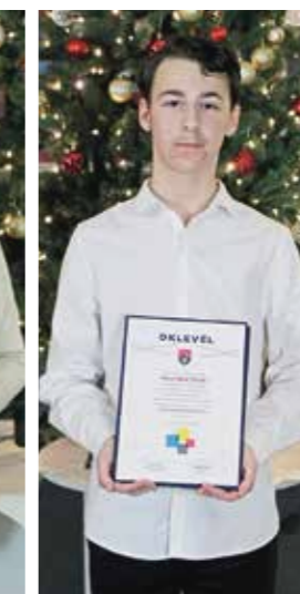
Marsi Márk Mihály Gyáli Bartók Béla Általános Iskola - 8.a