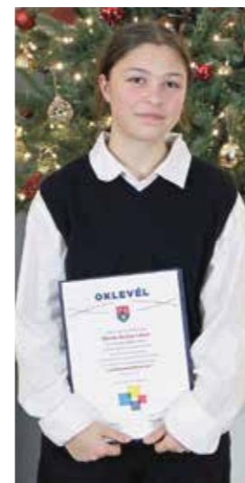
Révay Emma Laura Gyáli Zrínyi Miklós Általános Iskola - 8.b