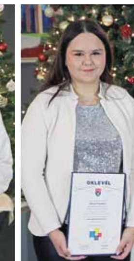
Garai Fruzsina Gyáli Bartók Béla Általános Iskola - 8.b