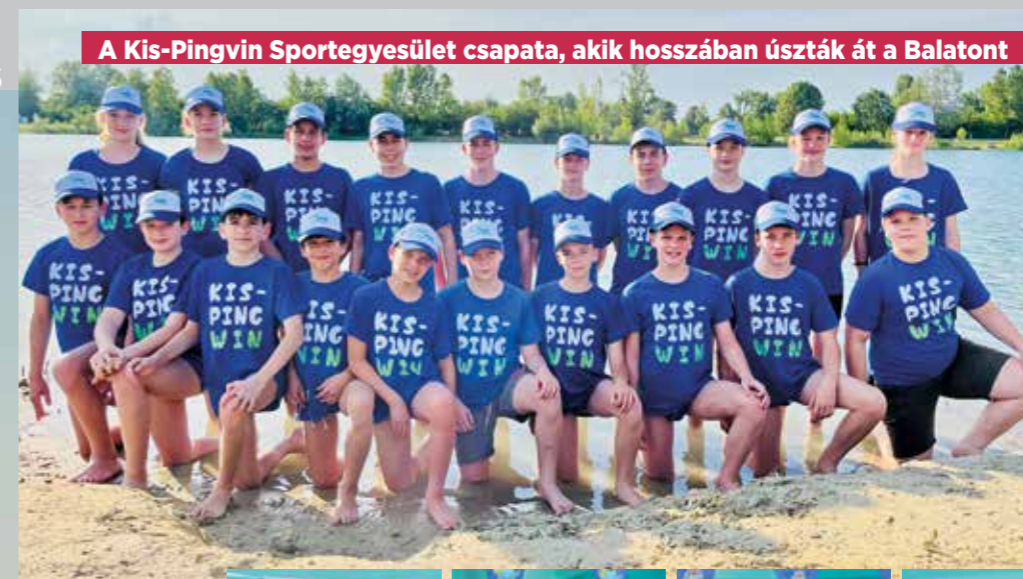
A Kis-Pingvin Sportegyesület csapata, akik hosszában úszták át a Balatont