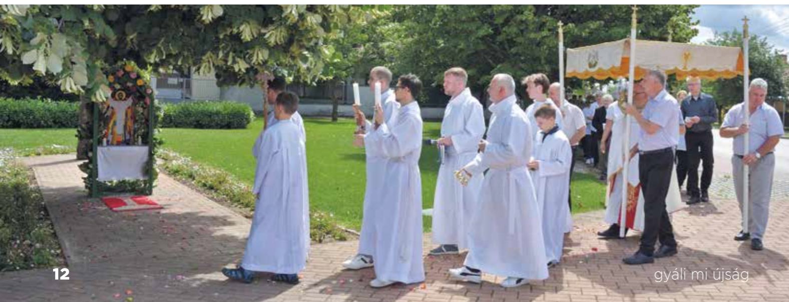
gyáli mi újság